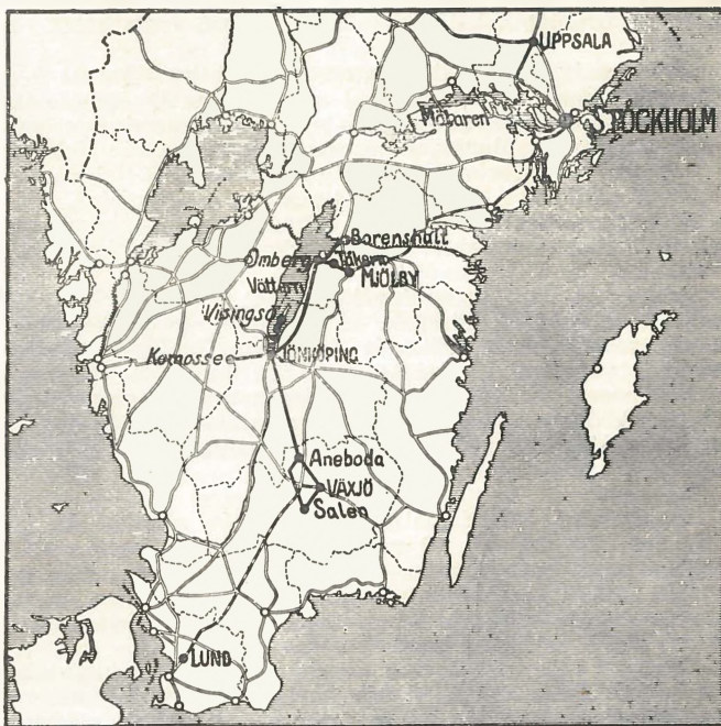
A IX. Limnológiai Kongresszus svédországi tanulmányútja. A megtett út: — vasuton, - - - autóbuszon és ... hajón.

VIII. 8. Hajóút a Vättern tavon: reliktumok gyűjtése, alászat. A láp élete iránt érdeklődők csoportja ezalatt a Komosse-lápra tett kirándulást.