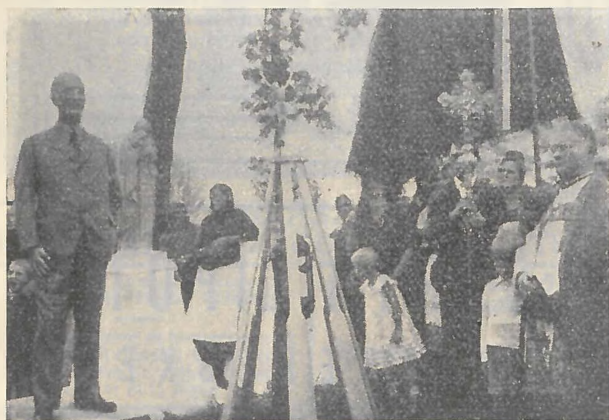
1. kép. A mindszenti halásznapi.