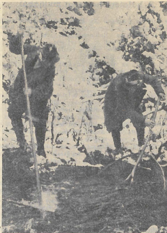
3. kép. Pataki galóca (szajbling) fogás a Kis-Gödében farkashálójával (hajtással).

Két óra leforgása alatt mintegy 10 pataki galócát sikerült fogni, melyek legnagyobbika, egy gyönyörű nászruhás hím 19 cm. hosszú. Október végén halásztunk s az időjárás tekintetében igen változatos napokban havazásra fordult az idő. Szébb színeket alig lehet elképzelni, mint aminőkben a friss hóra kivetett nászruhás hím galóca