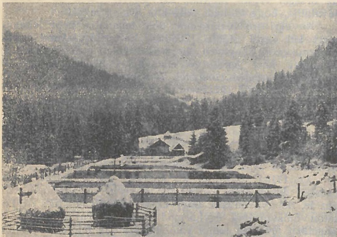
2. kép. A gödei halastavak (1941. október végén).

A Görgényi Hegységben az amerikai galóca a Marosba Gödemesterházánál beömlő Göde patakban él, még pedig annak is csak egyik ágában, a Kis Gödében. Itt is aránylag rövid szakaszra korlátozódott. Kb. a Marostól számított 10 km-nél kezd feltűnni, a Magura mare-ról lefutó (baloldali) mellékpatak beömlése feletti szakaszon, a 986-os magassági pont táján, a forrásoktól néhány km-nyire. A Magurai patak beömlése alatt állítólag nincs pataki galóca. A halastavak, amelyekbe eredetileg talán szívárványos pisztráng-ivadékkal kerülhetett be amerikai galóca is, a Nagy Gödében vannak, közvetlenül a két Göde egyesülése fölött, a 684-es magassági pontnál. A Nagy Gödében azonban a pataki galócát nem fogták.