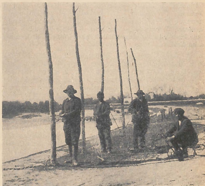
A beállítás .

őreg is lehet, ha nem is mindig egészben, de egyes részeiben, amennyiben apáról fiúra száll. A halászásra egész éven át alkalmas, a jeges halászatnál is ez használatos, már ezáltal is kiválik jelentősége a többi szerszám közül. Nincs kötve sem a vízálláshoz, sem az időjáráshoz a rendkívüli áradásokat vagy viharokat kivéve. Készítését minden halászmester maga végzi a többi halász segítségével. Mesterszóval ezt a munkát « beállításnak » nevezik, mellyel együtt jár az áldomás, amihez hozzátartozik