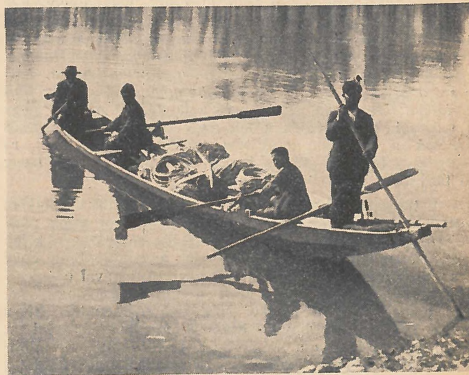
Indulás halászatra az öreghálóval.

Az öregháló járulékos szerszámai a « hálós-ák », és a « büszke ». A hálós-ák arra való, hogy a hálóban megfogott halat belerájkják addig, míg a « hegyes » vagy nyargaló bárkában kerül. Vagy pedig a bekerített nagyobb halat megfogják (pl. csuka, balin), ha menekülni akar a hálóból, mielőtt a hálót partra húzzák. Másik szerszám a « büszke ». Egy méteres karófából. Alsó vége hegyes és rendszeren vassal van ellátva. Van hegye , viszája (ez egy a hegyétől mástól arasznyira kiálló, arasznyi hosszú, fagyag vasszeg) és szára. Ezt a folyó, tehát sebesvíz halászásánál használja a laptáros . Ezzel tartja meg a hálót, vagy ereszti a víz mentén lépésről-lépésre úgy, hogy a hegyét változtatva a földbe szúrja. A büszke vagy szolgabot