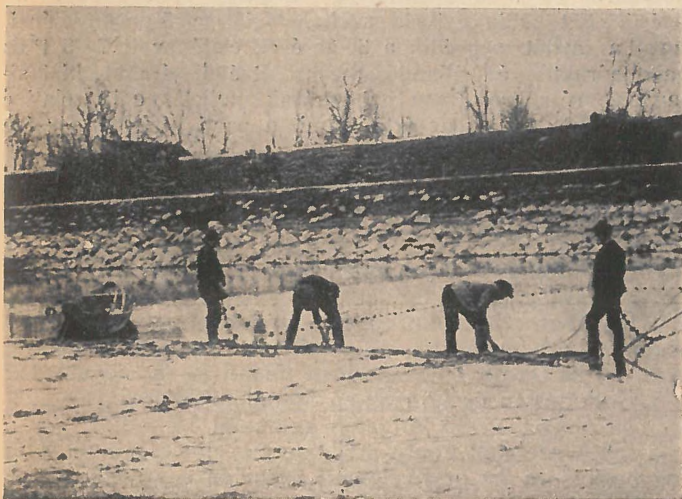
«Kerítés az öreghálóval.»

A ladik másik részében a faránál szintén két ember