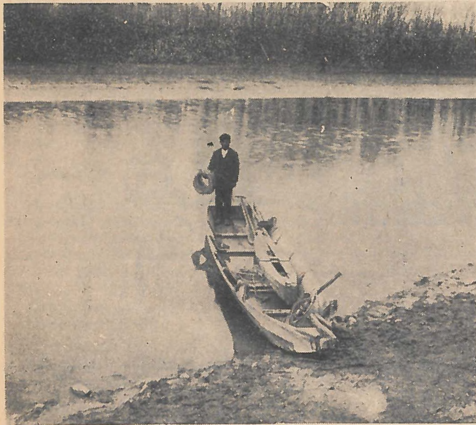
Rátakarítás. A halász kezében a nagy alattság.

A háló azért van részekre osztva, hogy ha elakad, oda ne vesszen az egész. Ezen hálórészek hosszát a puntok száma szabja meg. Ezek 35 háőszemet összefogó zsinórok a háló alsó és felső részén levő köteleken, az « inak »-on. A felső ina (nem in) neve « fcl » az alsó egy-