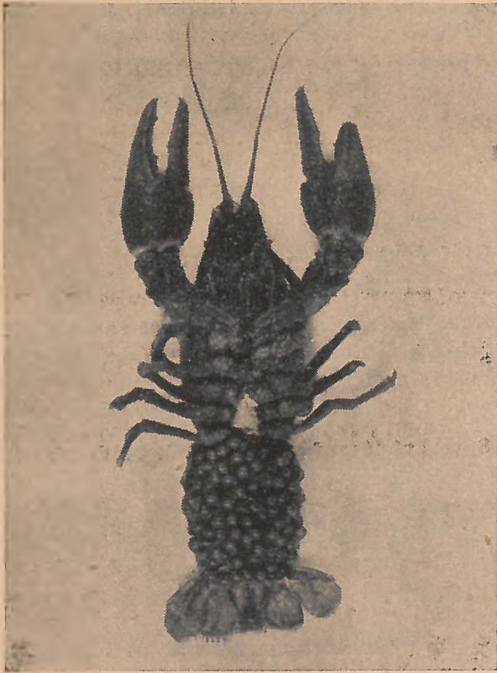
3. kép. Petés folyami rák.

Párosodása, szaporodása is a vízben történik. Párzása október végére, november elejére esik. Ekkor a hím az ondót a nőstény ivarnyílása köré s a farka végére keni s a pete az anya testéből való eltávozás után ezzel termékenyül meg. Ezt a jelenséget igen jól megfigyelhetjük az ebben az időben kézrekerült ivarérett nőstényeknél, mikor mindegyik ivarnyílása körül s a farka végén látható a meszes bevonatszerű ondó. A megtermékenyített petéket a nőstény fürtökben a fark alatti úszólábakhoz ragasztja s a behajlított fark végével védi. (3. kép.)