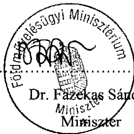
Dr. Fazekas Sándor Miniszter