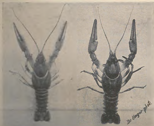
3. sz. kép. Kecskerák ( Astacus leptodactylus ). A balatoni sokkal világosabb, mint a dunai.

Ezzel a faji kérdés tisztázódott. Ámde a faji különbségeken kívül lehetnek más különbségek is, sőt a tisztelt olvasók a képeken alighanem már észre is vették, hogy a balatoni és a nem balatoni süllők színükben mennyire különböznek egymástól, ha a faj azonos is és ugyanebben a balatoniak mennyire megegyeznek, ha a faj különböző is! A balatoni fogas és a kősüllő is világos, szinte ezüstfehér, a más vizekből valókhöz képest.