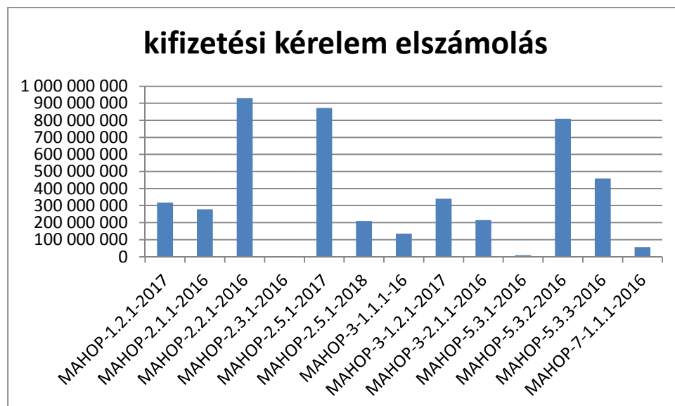
2. ábra: MAHOP kedvezményezettek részére kifizetett tényleges elszámolás

2019. december 31. napjáig a kedvezményezettek összesen 4.633.496.474 Ft támogatással számoltak el az IH felé: