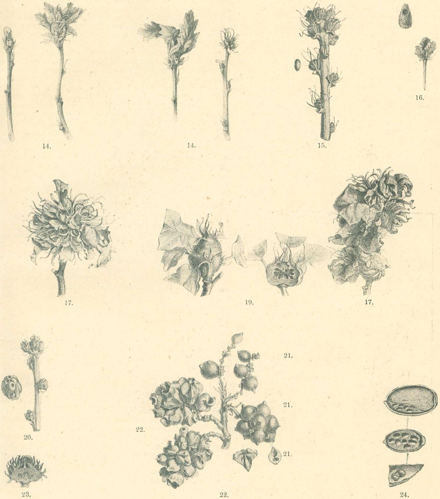
14. Neuroterus obtectus Wachtl — 15. Andricus circulans Mayr. — 16. Andricus cryptobius Wachtl. — 17. Andricus multiplicatus Gir. — 19. Andricus cydoniae Gir. — 20. Andricus burgundus